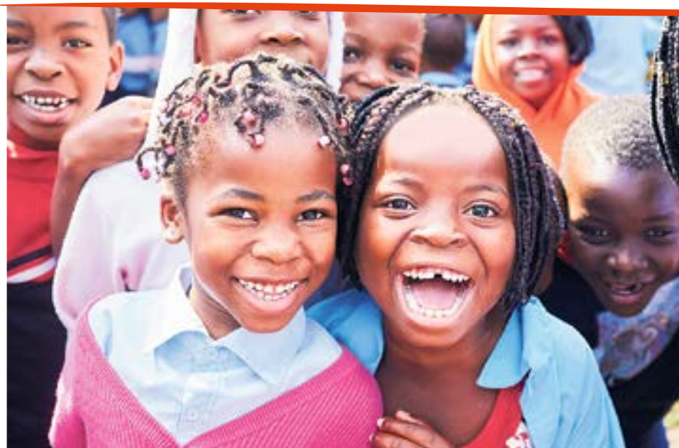
Meilleures perspectives d'avenir: le bonheur se lit sur le visage de ces enfants d'une école de l'île d'Inhaca à l'est de la capitale Maputo.