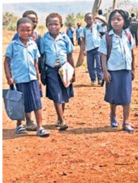
Au Mozambique, les enfants ont souvent un long trajet pour se rendre à l'école.

La Fondation Village d'enfants Pestalozzi a l'intention de réaliser cette année encore un premier projet dans le domaine de l'aide aux filles en périphérie de la capitale Maputo. L'aide aux filles est nécessaire, parce que les femmes sont plus souvent illettrées que les hommes. Un bureau a déjà été loué et la Fondation est enregistrée dans le pays. Le travail de projet peut donc débuter.