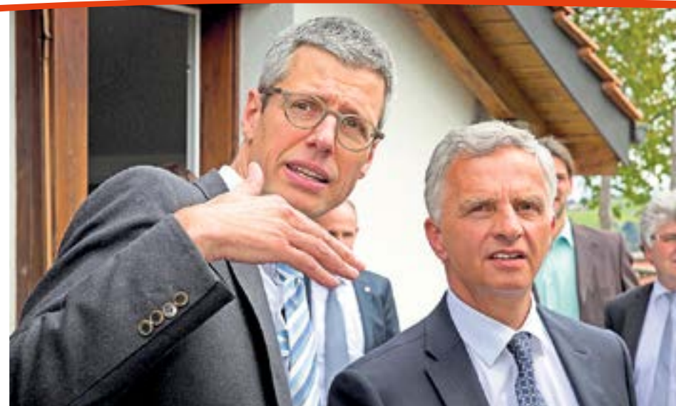
Urs Karl Egger avec l'ancien conseiller fédéral Didier Burkhalter lors de la visite de celui-ci au Village d'enfants Pestalozzi en mai 2016.

La recrudescence des conflits armés ces dernières années, mais aussi des préjugés, des discriminations, du ra-