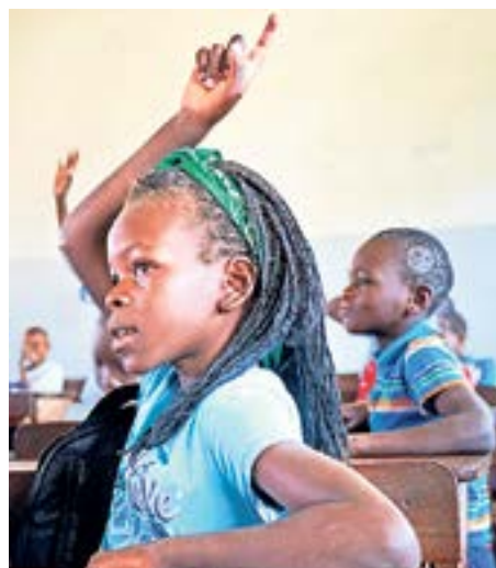
Dans un premier temps, en particulier les filles sont encouragées.