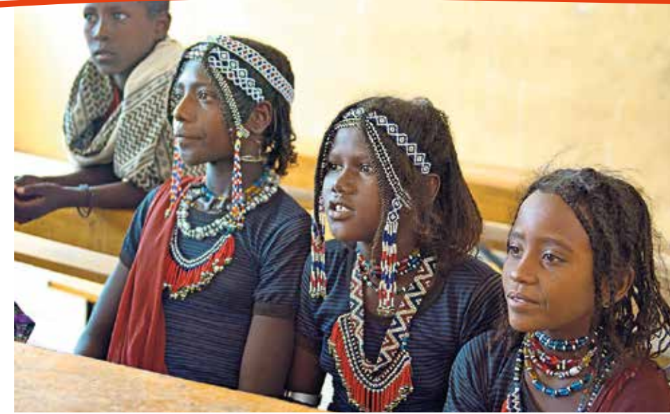
Projet éducatif 2017: Les enfants des peuples de bergers nomades dans la région Afar en Ethiopie écoutent leur maître.