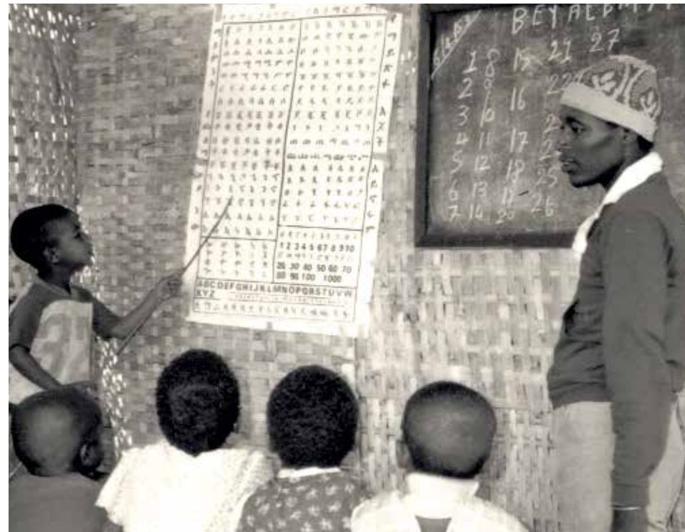
La Fondation Village d'enfants Pestalozzi est active en Ethiopie depuis ses premières interventions humanitaires à l'étranger en 1982.