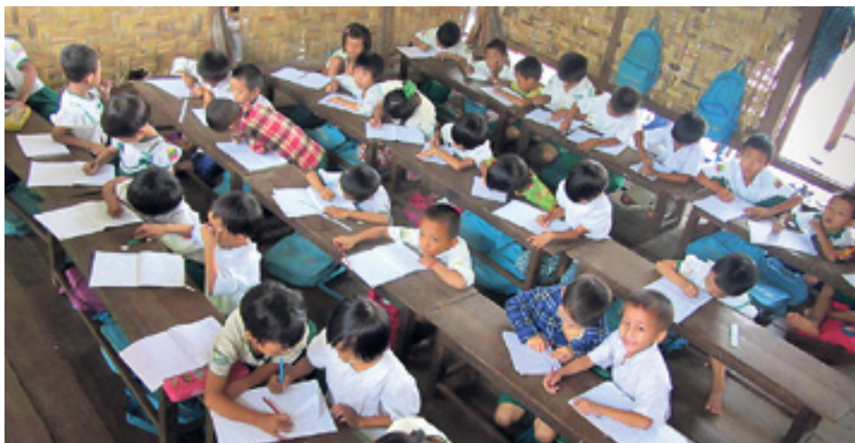
Les enfants sont sensibilisés à la protection de l'environnement en classe.

Dans le cadre de notre projet «Ecoles propres et vertes», nous tentons de sensibiliser les enfants et les enseignants aux questions environnementales. Les écoles doivent devenir écologiques. Pour ce faire, le thème de l'environnement est intégré dans les programmes. Des comités d'élèves plantent par exemple des arbres sur des terrains de l'école. Nous organisons des activités autour de la gestion des déchets et de l'énergie, afin que les enfants comprennent les liens entre leurs agissements et les conséquences pour l'environnement. C'est très important de sensibiliser la jeune génération à la protection de l'environnement, parce que c'est la seule manière d'améliorer la situation. La formation des enseignants sur des thèmes relatifs à la protection de l'environnement constitue un autre aspect majeur. C'est en effet la condition de base pour un enseignement aisément compréhensible et adapté aux enfants. A cet effet, nous avons développé un manuel d'éducation environnementale auquel les enseignants peuvent se référer.