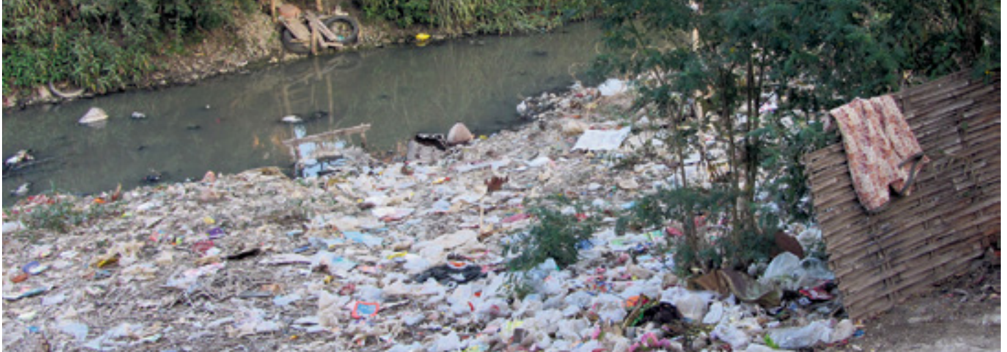
Les sachets en plastique, les emballages, les boîtes en alu et les bouteilles en PET sont simplement jetés par terre.