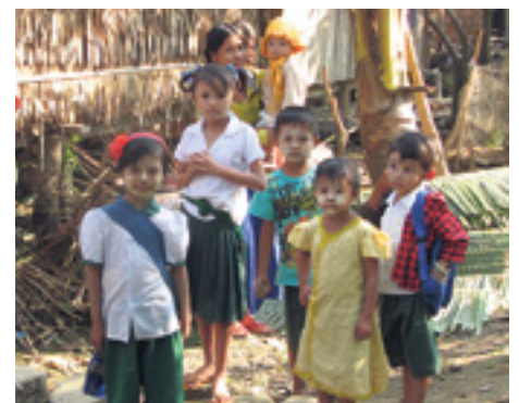
Les enfants apprennent à apprécier la nature.

Les habitants du village sont également intégrés dans le projet. Des solutions sont élaborées ensemble en vue d'exploiter durablement les arbres restants. Les habitants pourraient par exemple se contenter de couper des branches sans abattre tout l'arbre, qui peut ainsi continuer de pousser. Des parties apparemment sans intérêt, comme l'écorce, la sciure ou les gousses des plants de riz, pourraient servir de combustible. Au lieu d'un feu ouvert, on peut aussi construire des fours en argile; de cette manière, l'énergie est utilisée de manière plus concentrée et il faut moins de combustible.