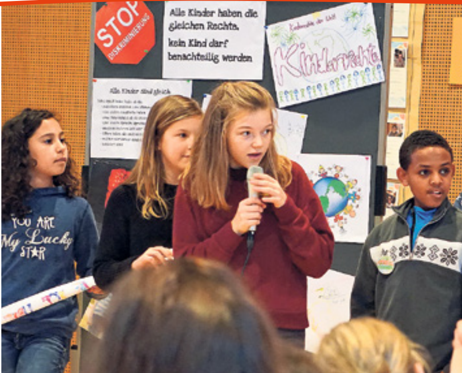
Des enfants âgés de 10 à 13 ans ont présenté leurs idées sur la manière de mieux aborder les droits de l'enfant à l'école lors de la Conférence nationale des enfants.

cès à une éducation de qualité et, ainsi, de bénéficier de meilleures chances d'avenir.