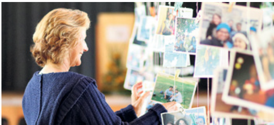
Des photos d'expériences partagées par des étudiantes et étudiants de la formation emPower décorent la halle polyvalente où la fête s'est déroulée.

En plus du programme emPower, la Fondation organise aussi des «Senior Professional Trainings» au Village d'enfants pour ses organisations partenaires. Contrairement à emPower, ces formations ne s'adressent pas à de jeunes collaborateurs, mais à des cadres de l'organisation, si bien que les contenus sont également différents: les stages d'une à deux semaines sont consacrés aux techniques de direction. Là aussi, les connaissances acquises sont mises en pratique dans les projets à l'étranger et contribuent à l'amélioration continue de l'efficacité. Depuis 2015, cinq stages ont déjà accueilli 78 personnes. Cette année encore, nous allons proposer des cours dans les domaines de la politique en matière de protection de l'enfance, la gestion financière et du personnel, les contrôles et l'évaluation de projets.