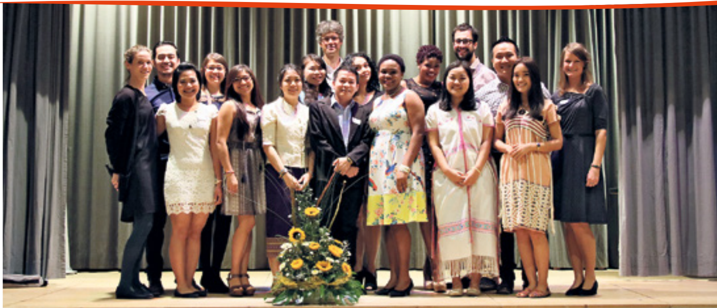
Les 14 étudiantes et étudiants du programme emPower après la remise des diplômes au Village d'enfants Pestalozzi.