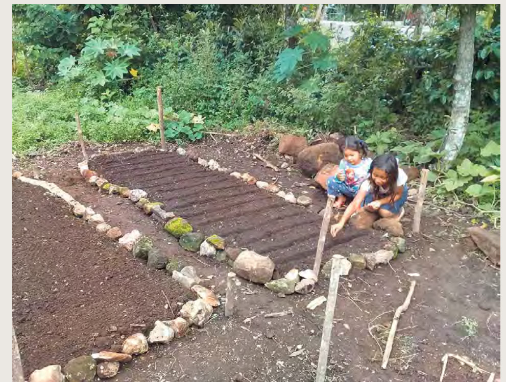
1618 personnes, dont 844 enfants, 740 familles, 20 écoles et 40 enseignants bénéficient du projet «Retour à l'école».