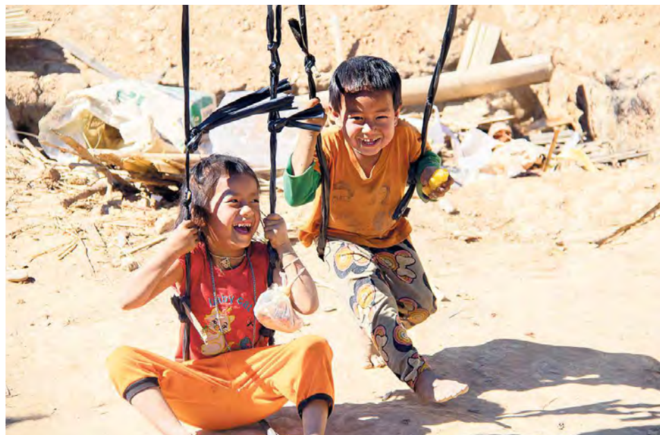
Au Laos également, les écoles ont fermé de manière préventive.

Les défis à relever sont tous différents dans chaque région du projet. En Asie du Sud-Est par exemple, le Laos présente un nombre incomparable de personnes atteintes du coronavirus. Les écoles ont fermé de manière préventive, interrompant brutalement l'éducation des enfants. Certes, des cours à distance officiels étaient diffusés à la télévision et accessibles sur le site Internet du ministère de l'Éducation, mais les enfants ne disposant ni d'un accès Internet ni d'un téléviseur ne pouvaient tout simplement pas les suivre. Les écoles