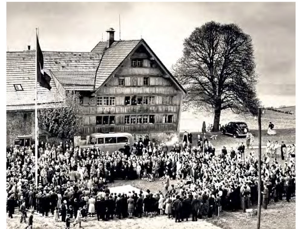
Pose de la première pierre 1946.

Les défis à relever pour résoudre, ou tout du moins apaiser ces situations, ont évolué ces dernières années, et demain déjà, ils ne seront plus les mêmes. À l'origine foyer construit pour les orphelins de guerre venus de toute l'Europe, notre Fondation a accueilli ces dernières décennies des enfants provenant de pays en crise d'autres continents ainsi que de nombreux enfants suisses en recherche d'un foyer sûr et stable. Ces dernières années, la Fondation s'est spécialisée à Trogen dans les échanges interculturels entre adolescents européens et Suisses, et s'est engagée plus particulièrement à offrir une éducation de qualité aux